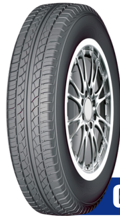
GREEN POWER S1