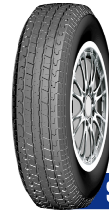
ST RADIAL TIRES